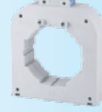
2000 / 5