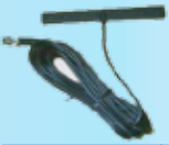
SP Kablo Anten (3m)