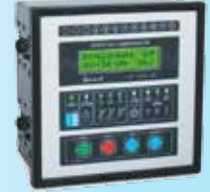
SMART SVC 12C3L / COM