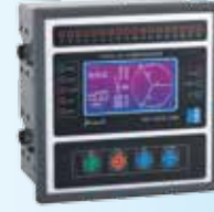
SMART SVC 18C3L / COM