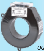
OG AKIM TRF 40/1