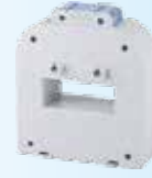
1000 / 5