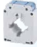
750 / 5